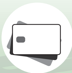
CARTES À PUCES SMART CARD

PUT SEPARATELY FROM ITEMS LISTED BELOW TO AVOID INTERFERENCE